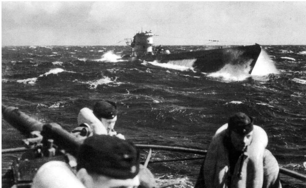
Немецкие подводные лодки в походе