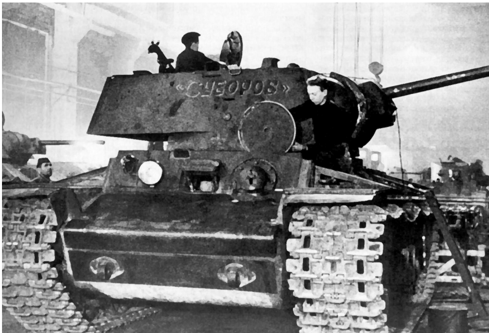
Ремонт танка на одном из заводов Москвы