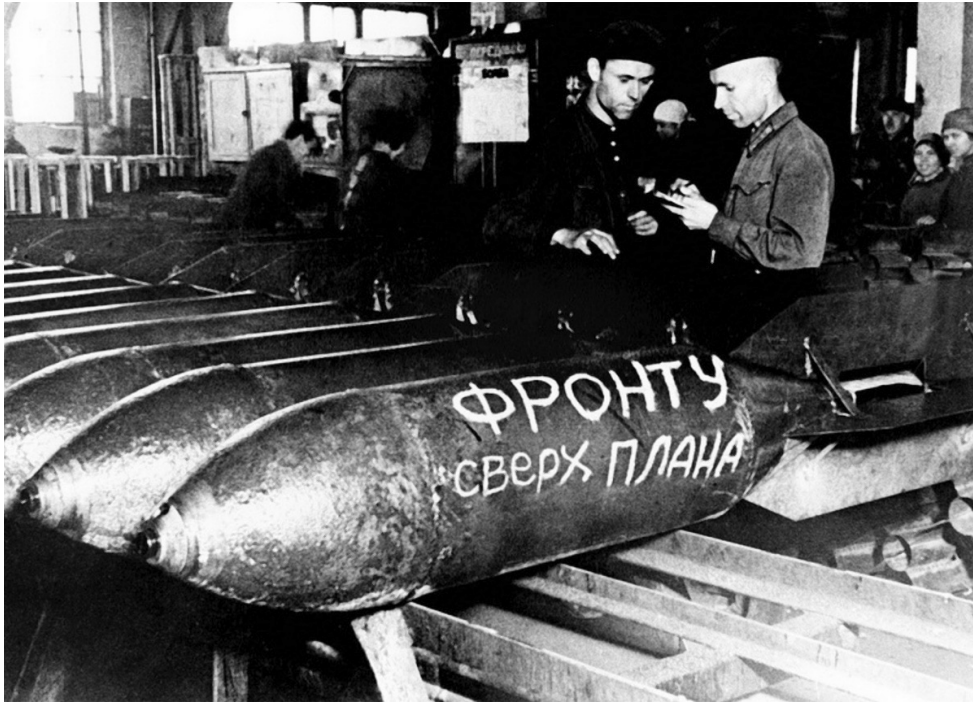
Выпущенные сверх плана авиационные бомбы в цехе сибирского завода