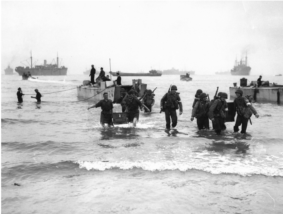
Высадка американских солдат в Алжире во время операции «Торч»