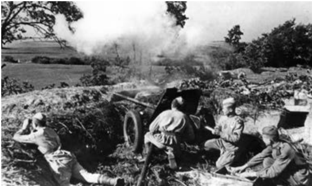
Бои юго-западнее Риги. 1-й Прибалтийский фронт, 1944 г.