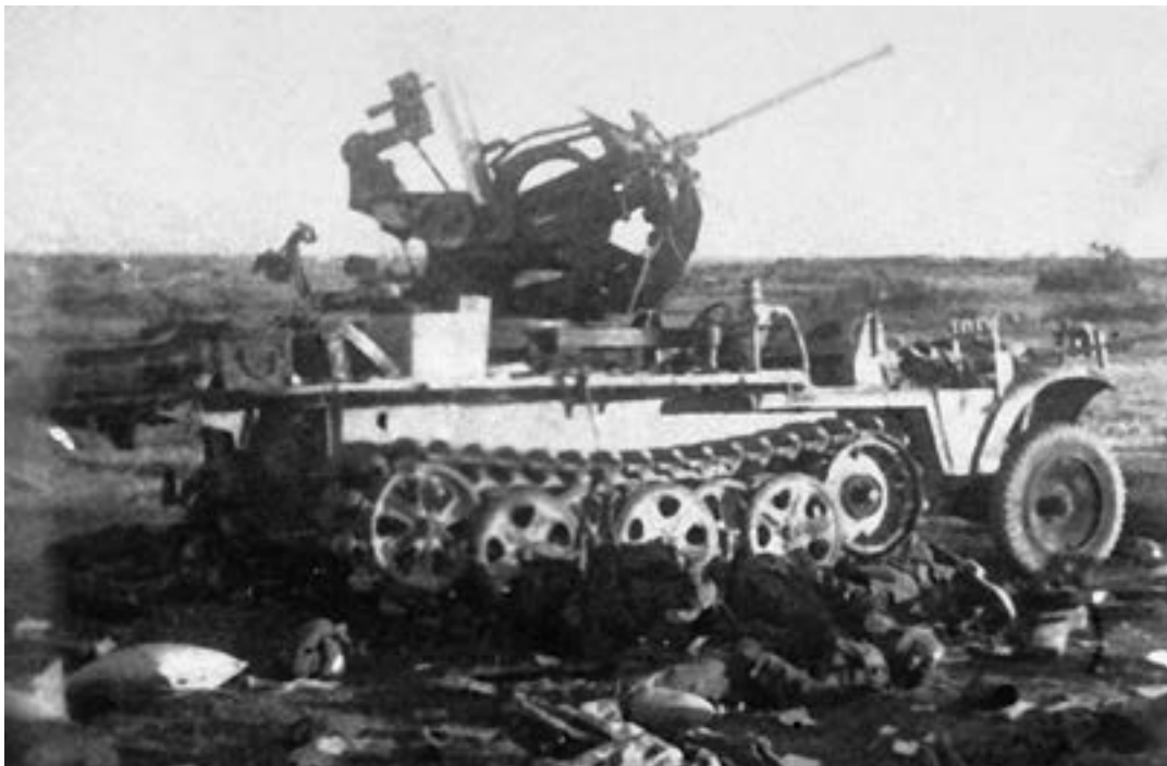
Результаты удара советских войск в районе Техумарди, на острове Сааремаа