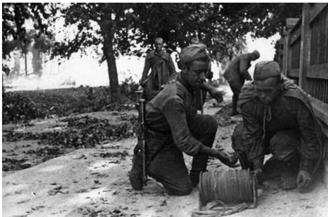
Советские связисты прокладывают линию связи во время уличных боев в Тарту. 1944 г.