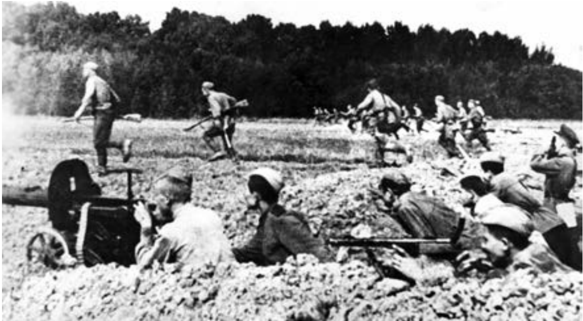
Советские войска наступают на рижском направлении. Октябрь 1944 г.