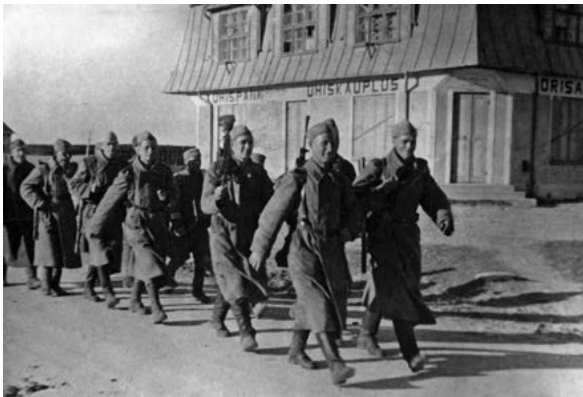
Колонна советских бойцов из состава 8-го эстонского стрелкового корпуса проходит по улице освобожденного города Ориссааре

вызвало у врага растерянность. «В наших подразделениях, — заявил на допросе плененный обер-ефрейтор Э. Фингрес, — высадка русских произвела суматоху и панику. Царило полное смятение. Офицеры проявили полную беспомощность, многие удирали как зайцы. Раненые были брошены на произвол судьбы» 321 .