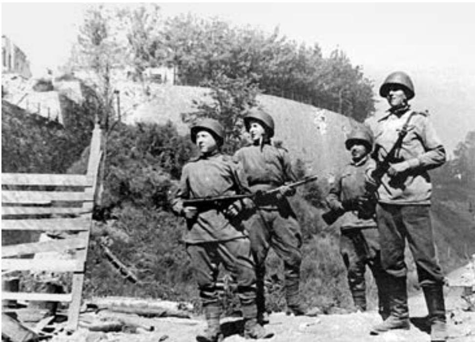
В освобожденной Нарве