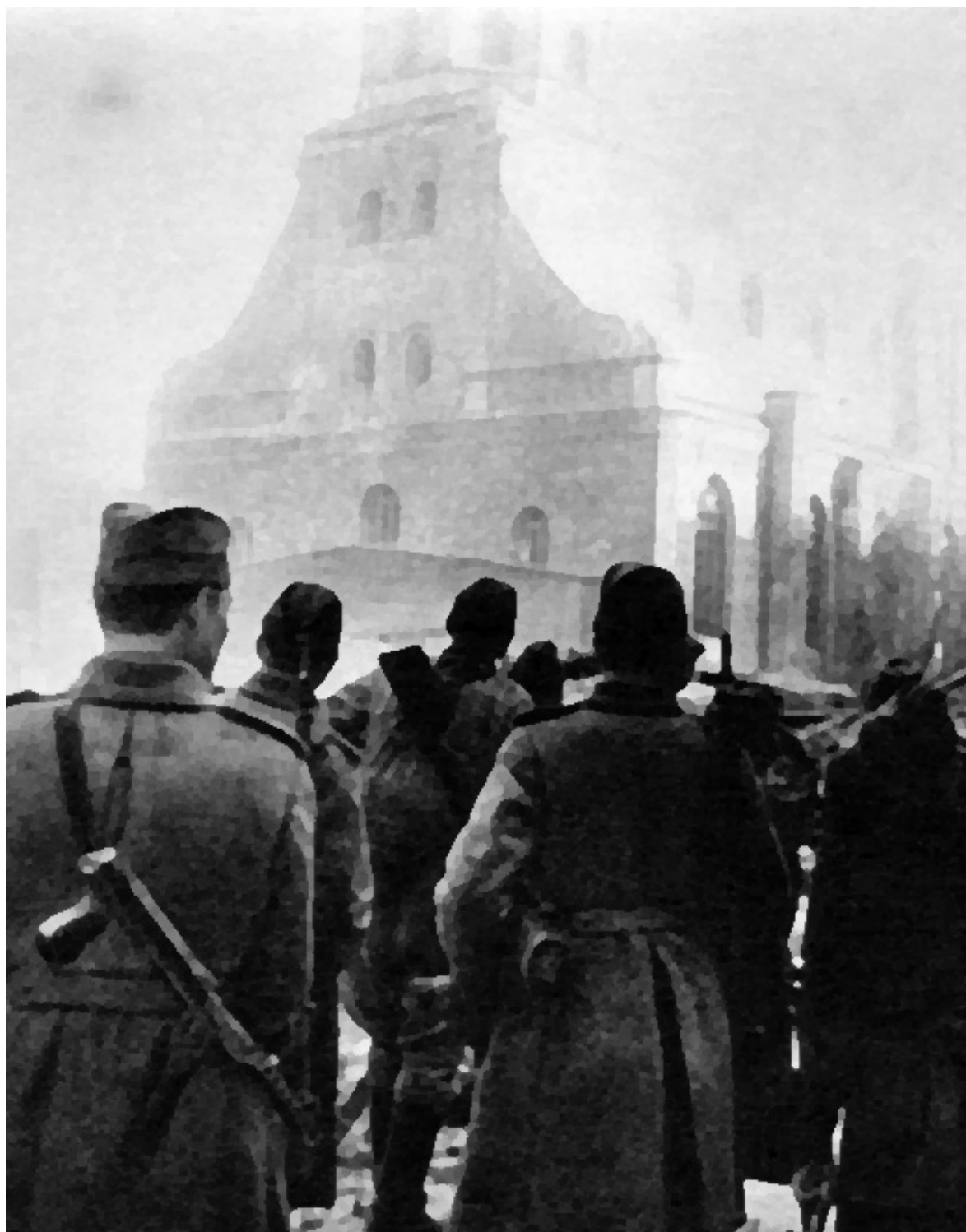
Советские солдаты на площади Риги