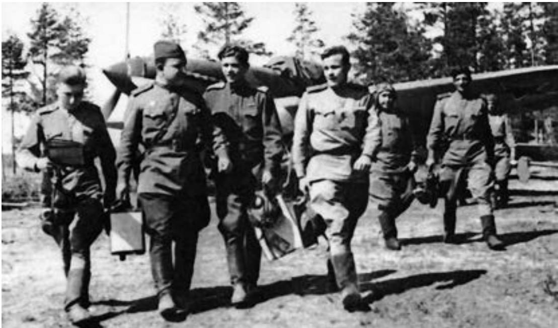
Летчики 872-го штурмового авиаполка