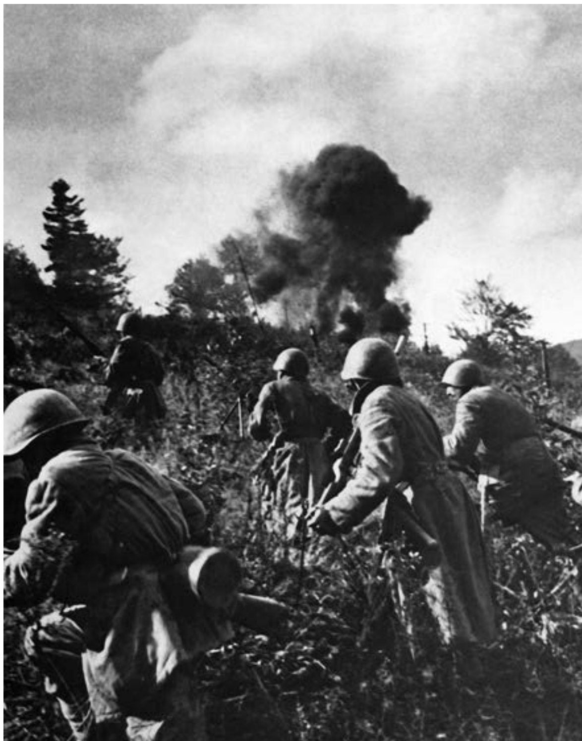
На штурм вражеских укреплений