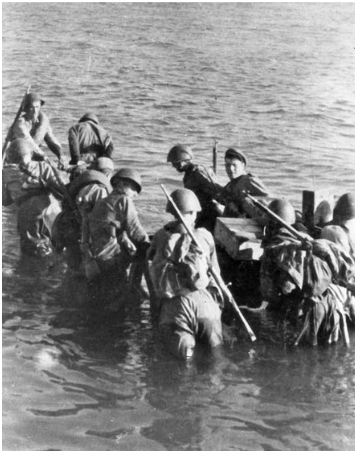
Высадка советского десанта на остров Сааремаа. 1944 г.