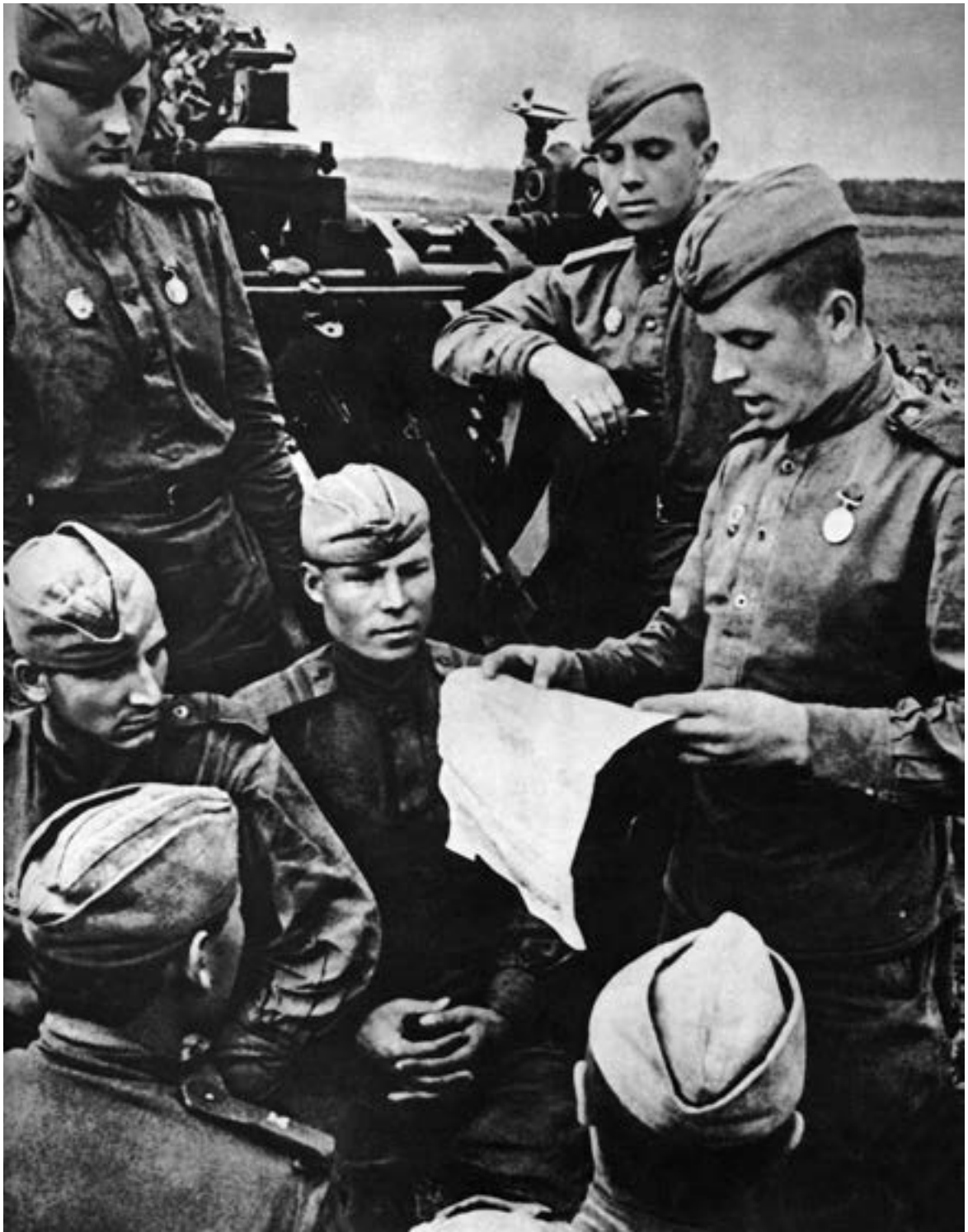
Политинформация в артиллерийском расчете