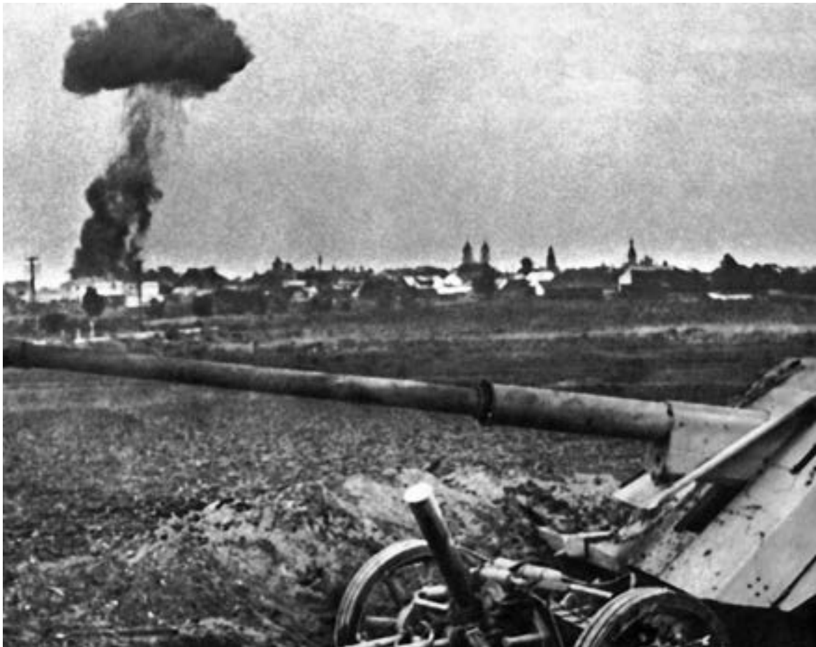
Отступая из Даугавпилса, гитлеровцы стремились взорвать и сжечь весь город

Верховного главнокомандующего ряду его соединений и частей были присвоены почетные наименования Двинских и Режицких. Тысячи солдат и офицеров были награждены орденами и медалями. Командующий войсками фронта генерал армии А. И. Ерёмченко был удостоен звания Героя Советского Союза.