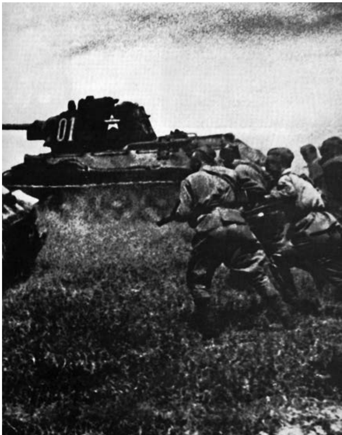
Наступление на рижском направлении началось. Сентябрь 1944 г.