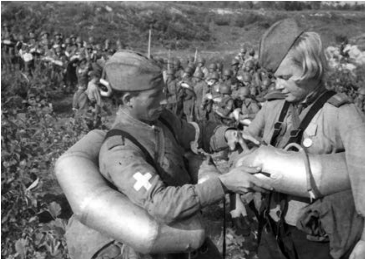
Советские солдаты проверяют снаряжение перед десантом на Моонзундские острова. 1944 г.