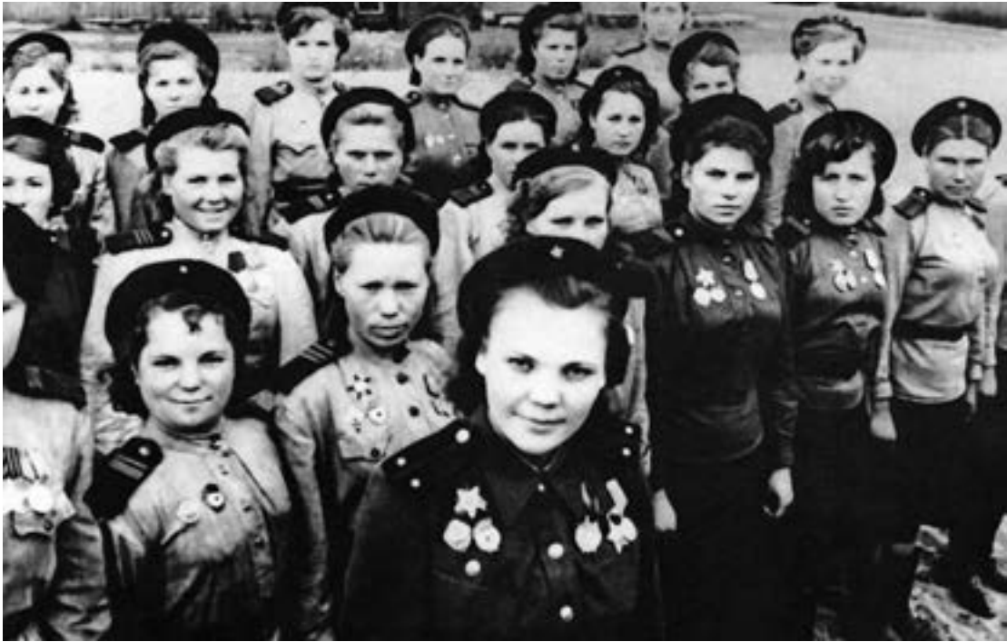
Снайперы 2-го Прибалтийского фронта