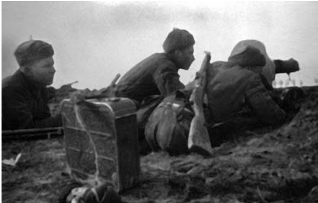
Пулеметный расчет на боевой позиции. 3-й Прибалтийский фронт, 1944 г.