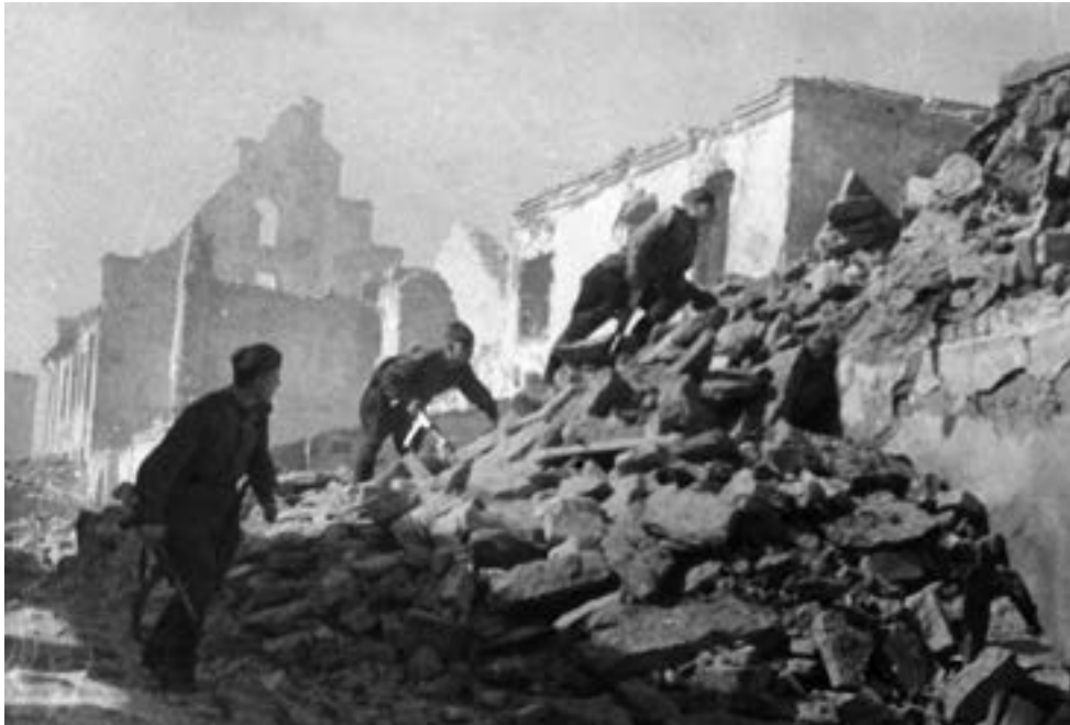
Советские автоматчики в уличных боях в Нарве. 1944 г.