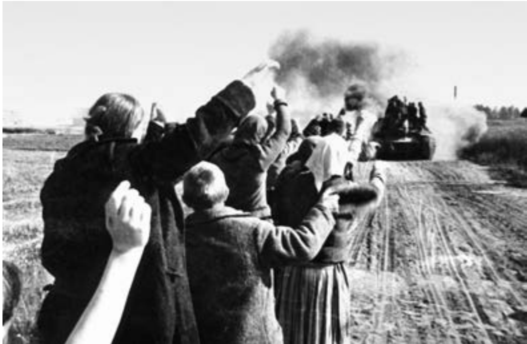
Население латвийских освобожденных районов встречает части Красной армии. 1944 г.