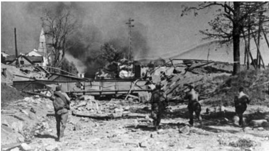
Советские пехотинцы ведут бой на южной окраине города Тарту. 1944 г.