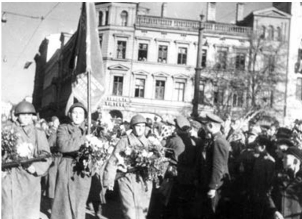
Советские войска проходят по улицам освобожденной Риги