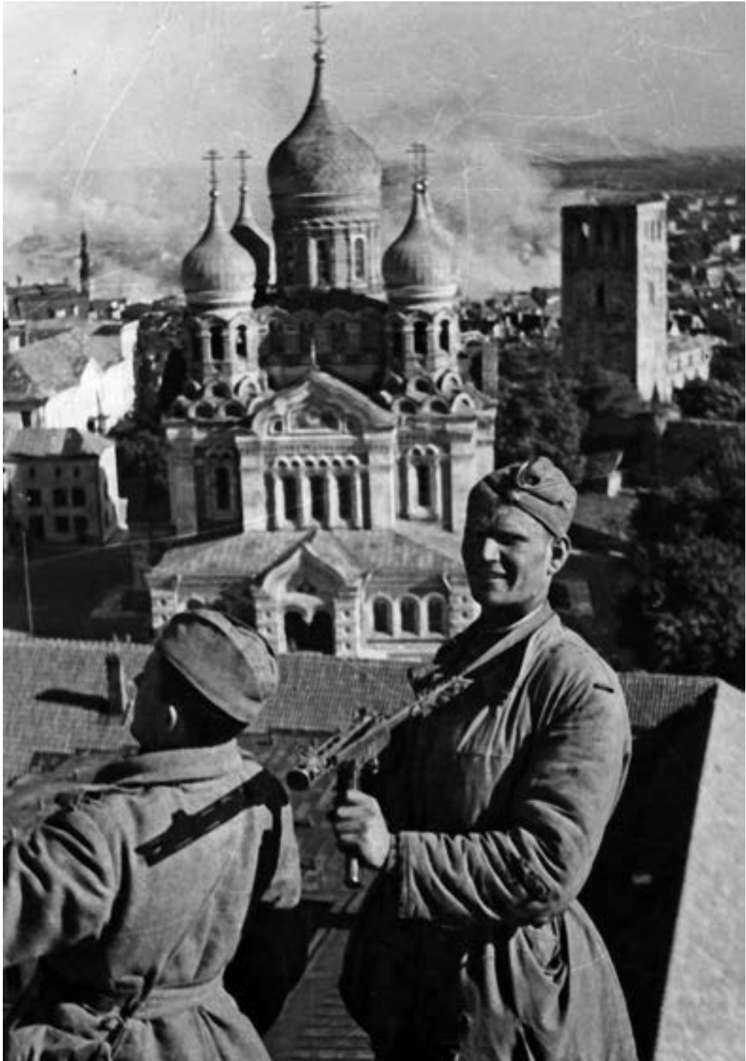
Советские солдаты в освобожденном Таллине. 1944 г.