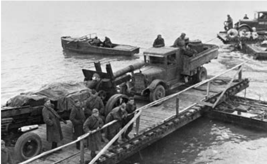
Переброска советской тяжелой артиллерии на остров Сааремаа