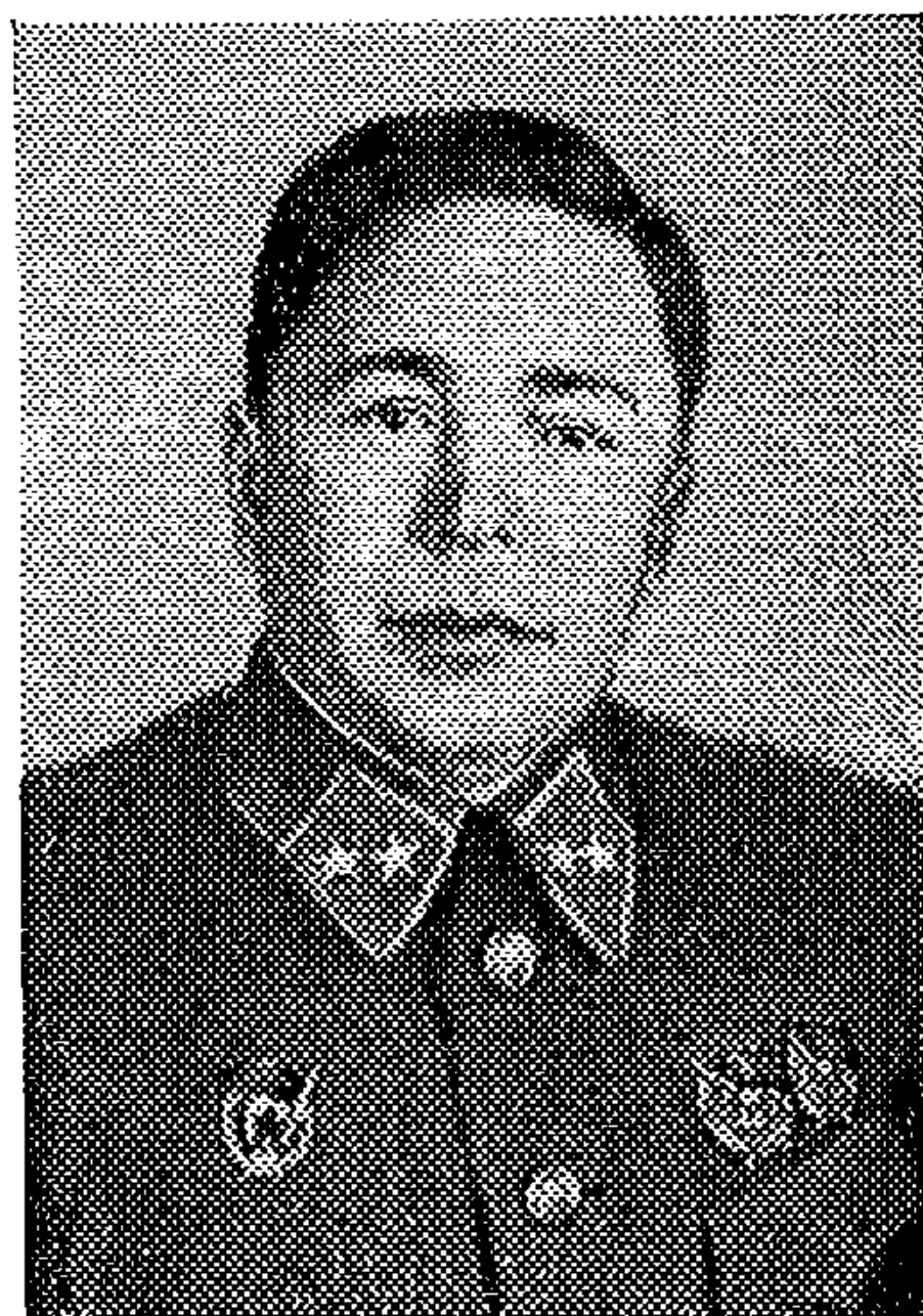
А. П. Белобородов

восходя в силах наши войска, имея большую подвижность, постоянную поддержку авиации, противник сравнительно легко создавал в процессе боя ударные группировки. Подмерзшая земля благоприятствовала ему. Он наносил удары то на одном, то на другом участке, добиваясь местного успеха. Нам же в каждом таком случае, поскольку достаточных резервов в глубине не имелось, приходилось снимать с какого-либо участка обороны часть сил, чтобы не допустить прорыва своей обороны на угрожающем направлении. Мы вынуждены были пятиться назад. За три дня непрерывного боя части армии местами отошли на 5—8 км. Но прорвать оборону врагу нигде не удалось.