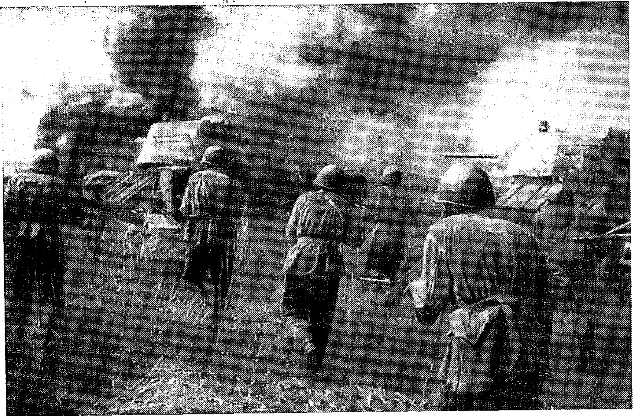
Июль 1943 года. Курская дуга. Контратака советских войск