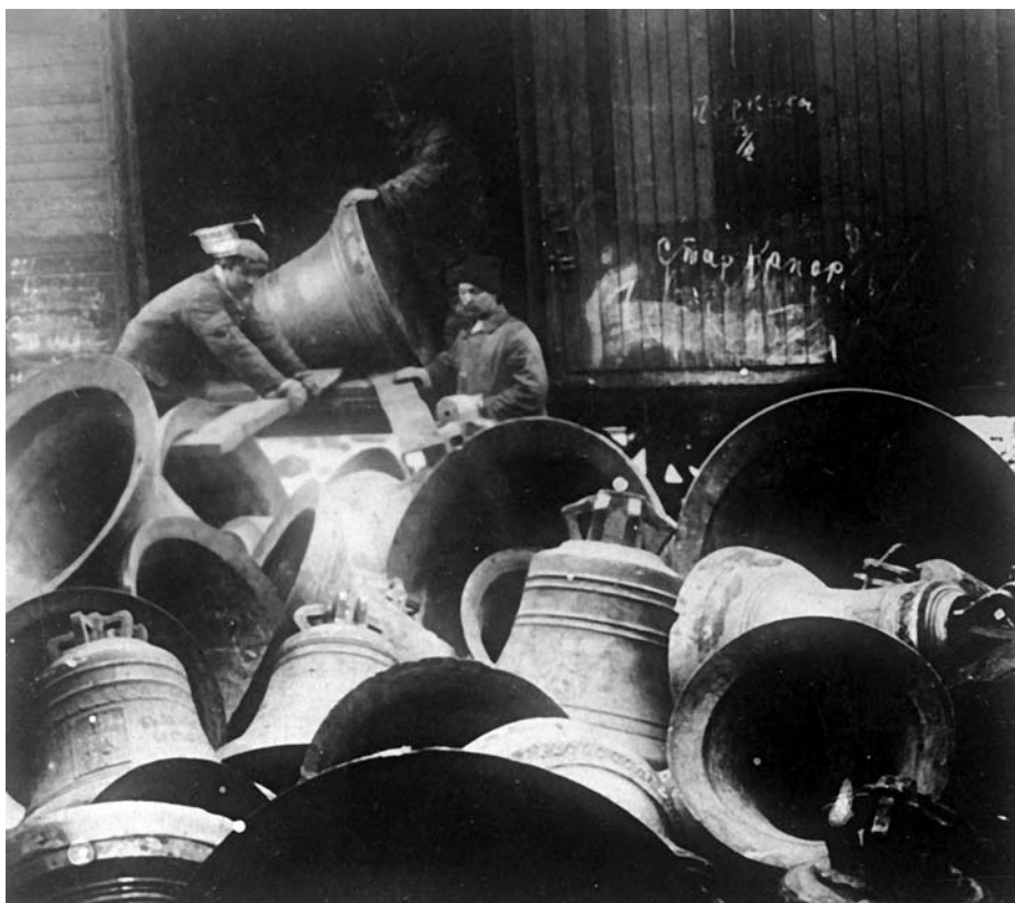
Церковные колокола перед переплавкой