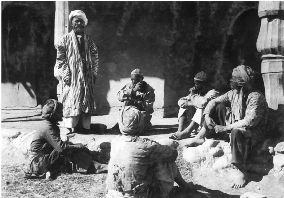
На улице Самарканда