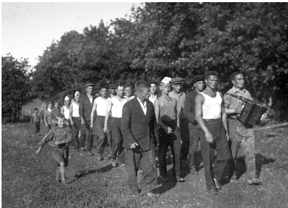
Трудовая молодежь возвращается с физзарядки