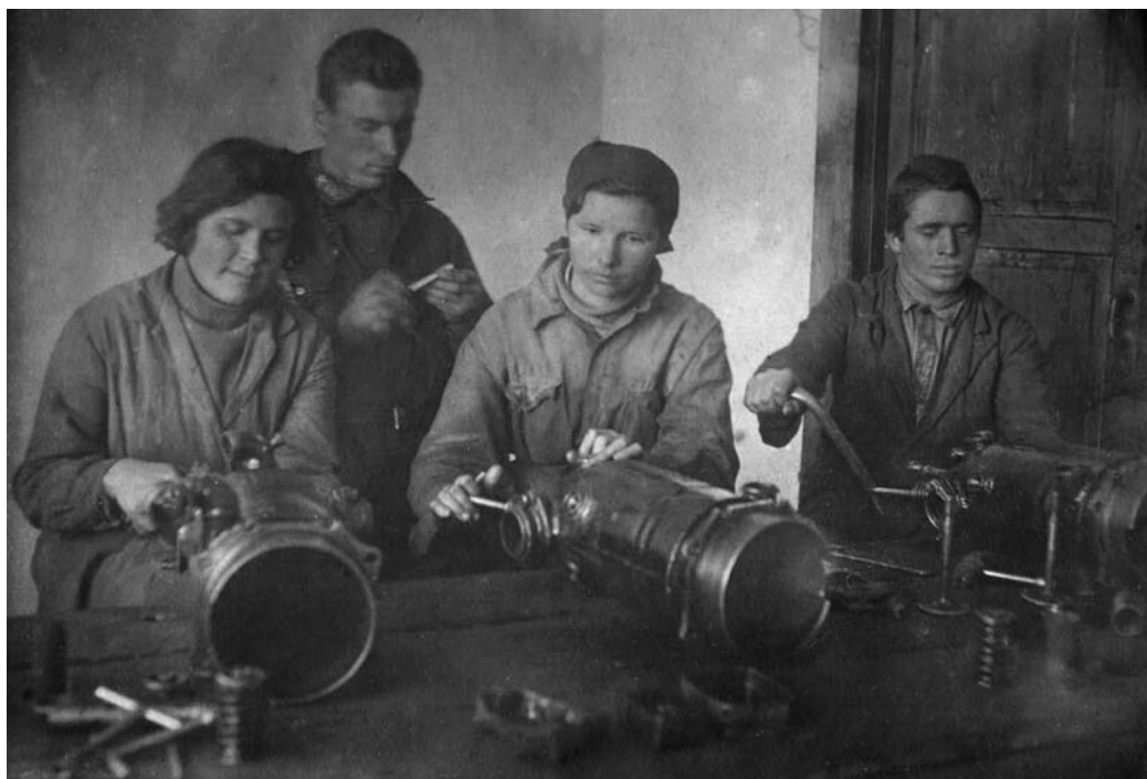
Выполнение оборонного заказа