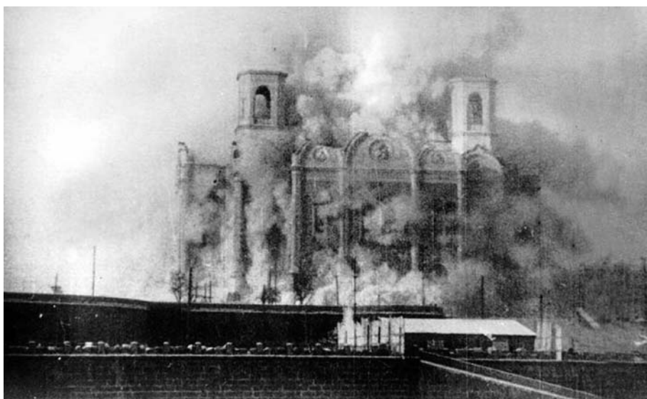
Снос храма Христа Спасителя в Москве