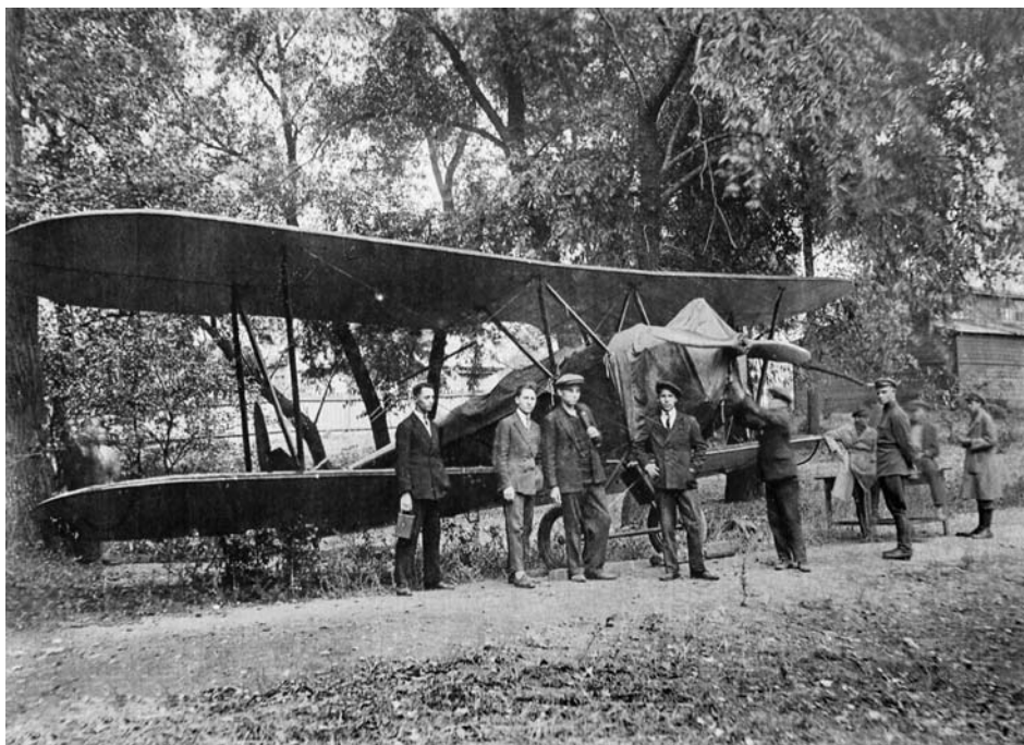
На занятиях Осоавиахима