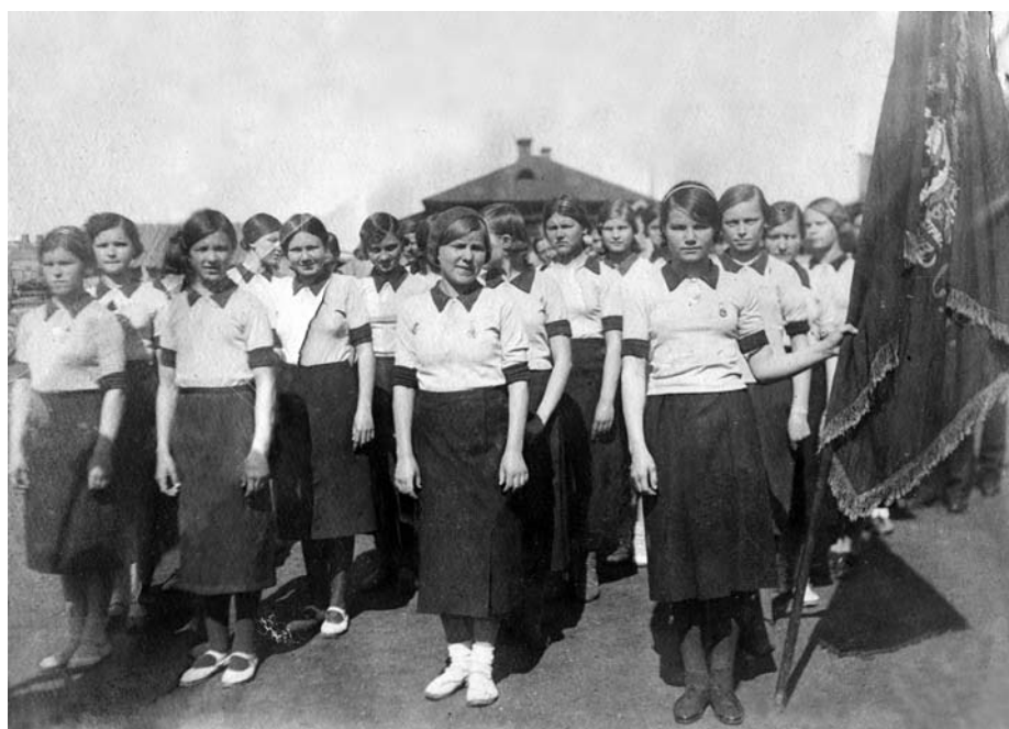
Учащиеся рабочего факультета