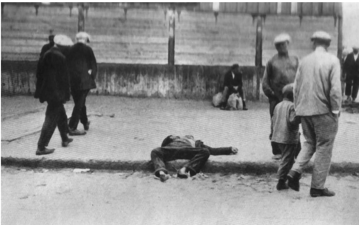
Умершие от голода. 1930-е гг.